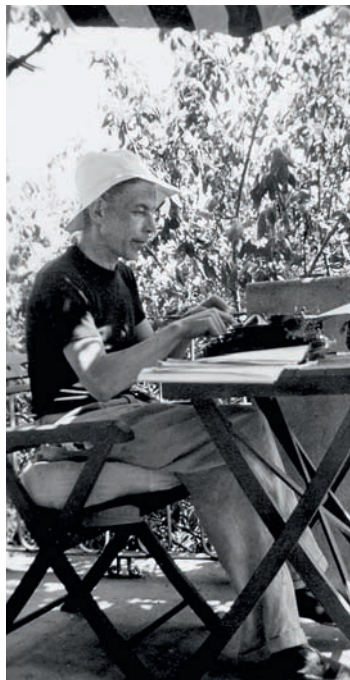
Ein prägendes Bild: Friedrich Glauser 1938 in Nervi bei Genua

Als rauchender Sprengel im Flatter-T-Shirt und mit weissem Hut an der Schreibmaschine sitzend auf der sommerlichen Terrasse in Nervi (Ligurien) hat sich Friedrich Glauser in manchen Köpfen eingeknistet. Wer etwas gelesen hat vom gebürtigen Wiener, der als Schweizer pausenlos auf der Flucht war, wird noch andere Bilder in Erinnerung haben: Den korpulenten, Brissago rauchenden Berner Kommissär Jakob Studer. Hagere Irrenhäu-