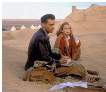
Der englische Patient: Ralph Fiennes, Juliette Binoche