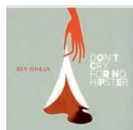
Ben Sidran Don't Cry For No Hipster (Bonsai/Harmonia Mundi 2013).