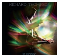
Richard Thompson Electric (Smart Music 2013).