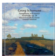
Georg Schumann Sinfonie in h-Moll/ Serenade op. 34 (CPO 2012).