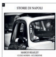
Marco Beasley Accordone Storie di Napoli (Alpha 2012).