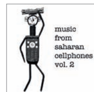
Music from Saharan Cellphones, Vol. 2. (Sahelsounds 2013).