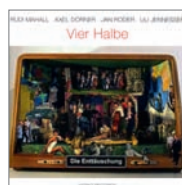
Die Enttäuschung Vier Halbe (Intakt 2012).