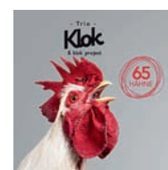
Trio Klok 65 Hähne (Unit 2013).