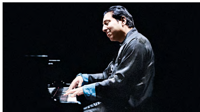
Fazil Say: Musikalisch genial und politisch engagiert

Igor Stravinsky Le Sacre du Printemps by Fazil Say (Teldec 2000).